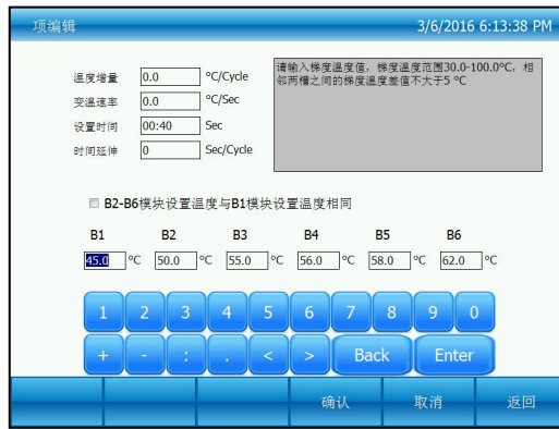
图五：选项内容编辑

需要设置梯度温度时，点击“B2-B6 模块设置温度与 B1 模块设置温度相同”前面的选择框，将里面的选择勾取消，这样可以在 B1-B6 模块上设置不同温度，相邻模块的温度值不超过 5 度，并且这些温度在 30℃ 到 100℃ 之间，如下图：按“确认”按钮，返回到编辑文件界面（图六）。