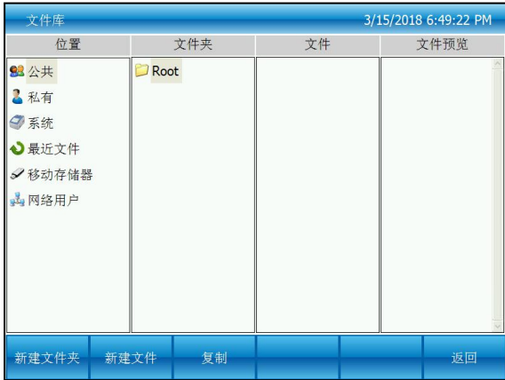
图一：焦点在公共根目录上