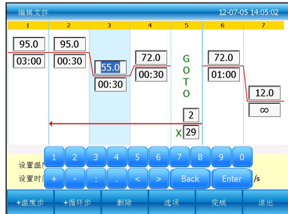
图四：编辑一个现有文件

在新建文件或编辑文件界面下按“+温度步”按钮，增加温度步骤。按“+循环步”按钮，增加循环步骤。