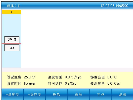
图三：创建一个新的文件

在图一界面下按“新建文件”按钮进入新建文件界面（图三），或在图二界面下按“编辑”按钮编辑现有的文件进入编辑文件界面（图四）。