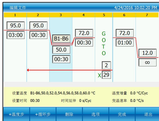
图六：步骤 3 已增加梯度项

需要设置梯度温度时，点击“B2-B6 模块设置温度与 B1 模块设置温度相同”前面的选择框，将里面的选择勾取消，这样可以在 B1-B6 模块上设置不同温度，相邻模块的温度值不超过 5 度，并且这些温度在 30℃ 到 100℃ 之间，如下图：按“确认”按钮，返回到编辑文件界面（图六）。