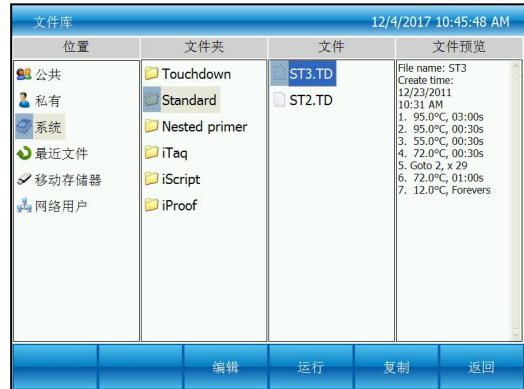
图二：焦点在系统文件上