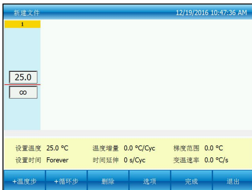
图三：创建一个新的文件

在图一界面下按“新建文件”按钮进入新建文件界面（图三），或在图二界面下按“编辑”按钮编辑现有的文件进入编辑文件界面（图四）。