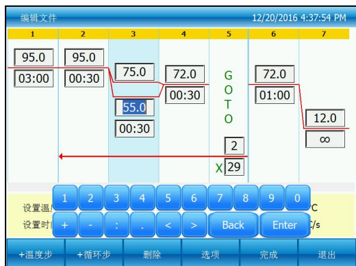
图七：编辑文件带梯度项

在梯度范围中设置范围，如图六所示，可以从右方梯度分布表查看温度梯度分布状况(梯度分布表中图像与模块相对应)，梯度范围输入完成后，按“确认”保存更改，并回到文件编辑界面，如下图七。