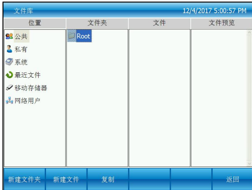
图一：焦点在公共根目录上