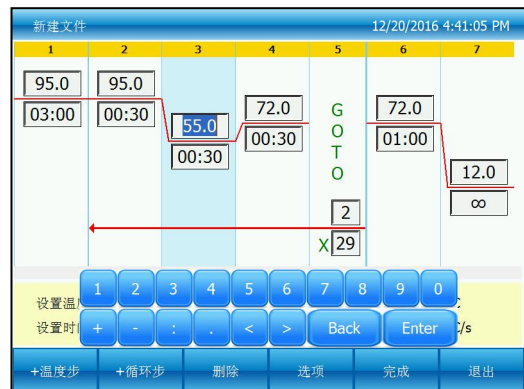
图四：编辑一个现有文件

在新建文件或编辑文件界面下按“+温度步”按钮，增加温度步骤。按“+循环步”按钮，增加循环步骤。